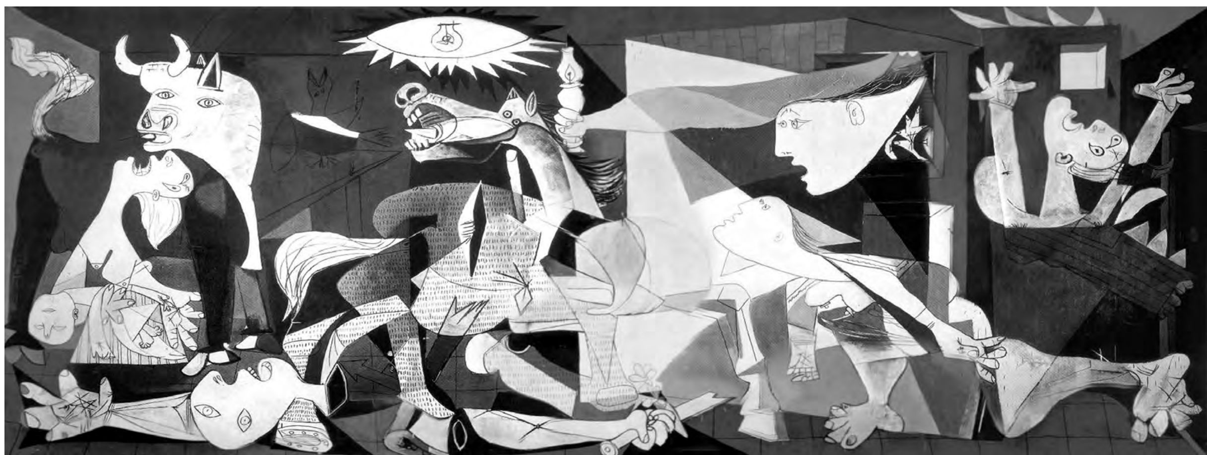
پابلو پیکاسو، «گرنیکا»، رنگ روغن روی بوم، ۳۴۹/۳ \times ۷۷۶/۶ سانتی‌متر، ۱۹۳۷، موزه ملی مرکز هنر رینا سوفیا، مادرید.

است که تصویر مشت گره کرده در هوا تصویری ماندگار در هنر اعتراضی است. از این تصویر هنرمندان در انقلاب مکزیک، دانشجویان امریکایی در اعتراض به جنگ ویتنام، دانشجویان فرانسوی در امتداد شورش پاریس و حزب بلک پنتر و هزاران معترض در طول زمان استفاده کرده‌اند. تصویر مشت گره کرده تصویری جهانی است که نمادی است از خشم و به پاخاستن مردم و می‌توان آن را به شکل گرافیکی ساده‌ای تقلیل داد.