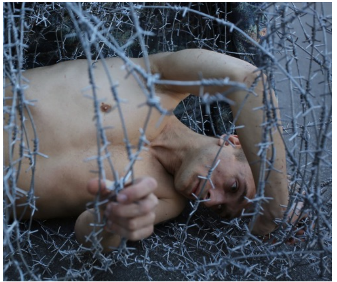
پیوتر پاولنسکی ، «لاشه»، هنر اجرا، ۲۰۱۳، سن پترزبورگ.

است که برای سرکوب فعالان مدنی و ایجاد رعب در جامعه اجرا می‌شوند؛ (۳) پرفورمنس میخ کردن خود به میدان سرخ مسکو برای اشاره به بی‌عاطفگی، بی‌تفاوتی سیاسی و جبرگرایی شایع در جامعه‌ی روسیه؛ (۴) پرفورمنس بریدن لاله‌ی گوش‌اش در اعتراض علیه روند روان‌پزشکی در روسیه که بر روی مخالفان و مرتدان به اجبار اعمال می‌شود. پاولنسکی برای سوزاندن در ساختمان فرماندهی امنیت فدرال روسیه در سال ۲۰۱۶ به سه سال حبس محکوم شد. چیزی که او را متمایز از هنرمندان مشابه‌اش می‌کند پرداختنش به ضعف و آسیب‌پذیری در پرفورمنس‌های اعتراضی‌اش است. پاولنسکی قبل از اجرای آثارش واکنش دستگاه قدرت و امنیتی را پیش‌بینی می‌کند؛ اگر آن‌ها با رفتاری خشونت‌آمیز به او پاسخ دهند، در نهایت طبق سناریو و پیام هنرمند رفتار کرده‌اند.